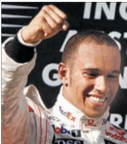
Der 23-jährige Brit Lewis Hamilton ist der erste Saisonsieger der Formel 1.

MUMMENSCHANZ 3 X 11 – Eine Retrospektive 18./19./20. März | 20.00 Uhr | Theater Casino Zug www.tmgz.ch Vorverkauf: 041 729 05 05